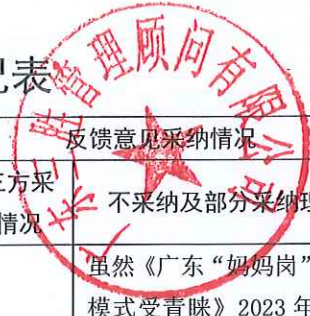
劳动力调查经费项目反馈意见采纳情况表